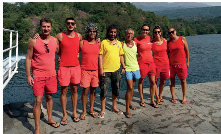
Gli Assistenti Bagnanti