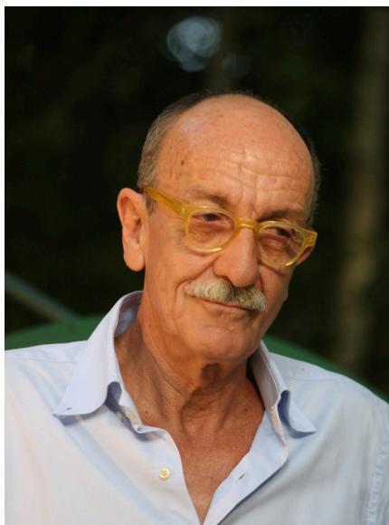
Il Magistrato Giuseppe Ayala

Non è solo il punto di vista privilegiato di un personaggio di prima linea nella lotta alla mafia, ma è anche la profonda